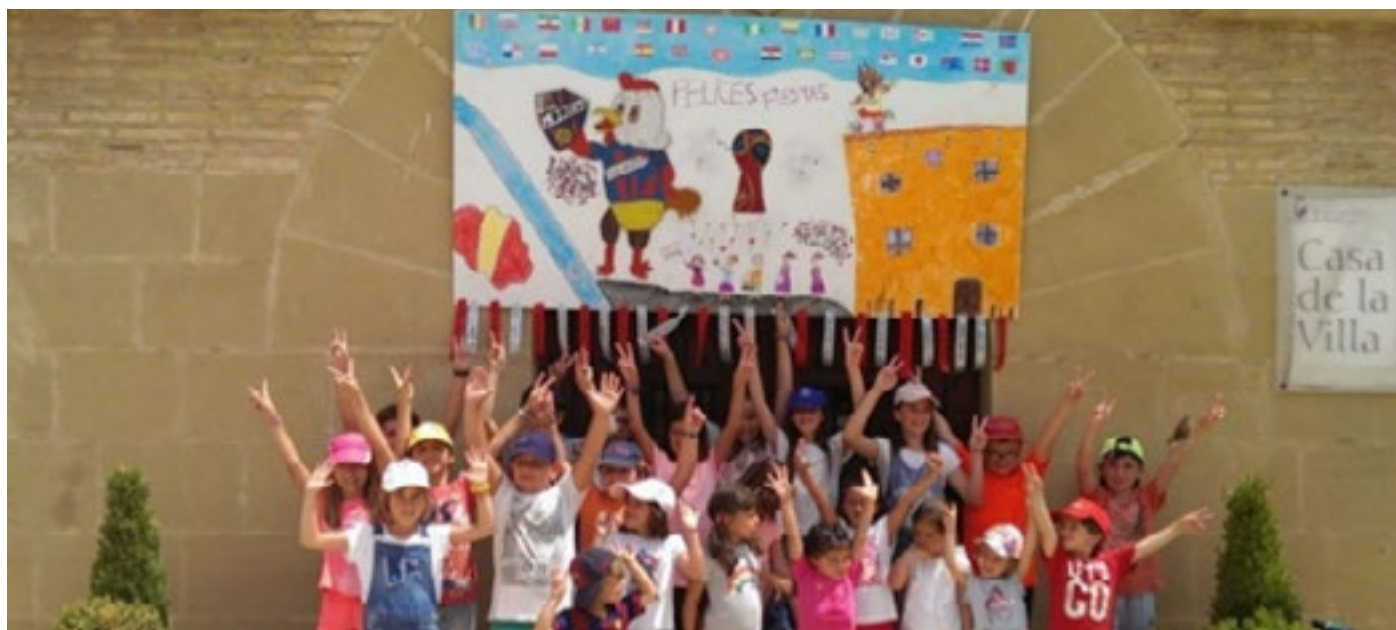
Foto cartel año 2018, realizado por los niños de la escuela de verano.

13:00. COLOCACIÓN DEL CARTEL DE FIESTAS EN EL AYUNTAMIENTO REALIZADO POR TODOS LOS NIÑOS Y NIÑAS DE LA ESCUELA DE VERANO.