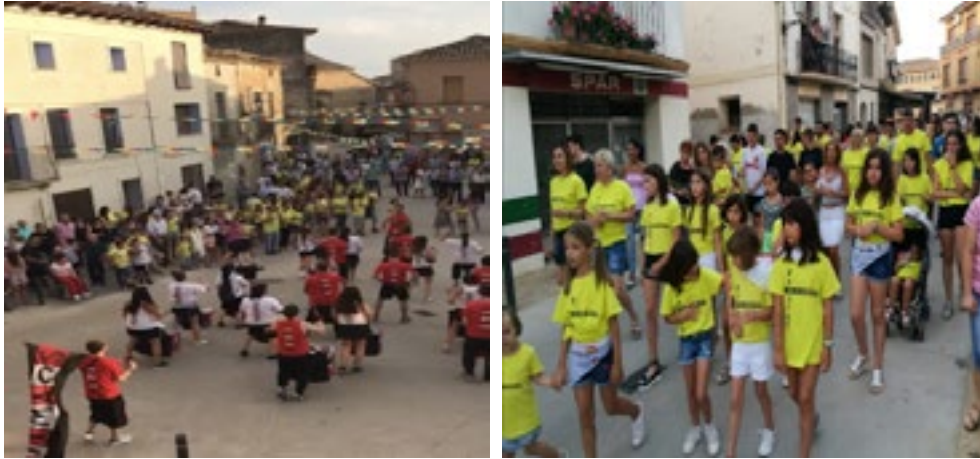
Fotos de la batukada y pasacalles de las fiestas del 2018.

20:30. TODOS PREPARADOS CON NUESTRA CAMISETA AMARILLA, UN AÑO MÁS NOS ACOMPAÑARÁ LA BATUKADA “RITMAOS” CON LA QUE HAREMOS VIBRAR Y BAILAR AL PUEBLO. Este año, acompañaremos la batukada con todas aquellas carrozas que quieran participar en el pasacalle y, como siempre, cerveza gratis toda la ronda.