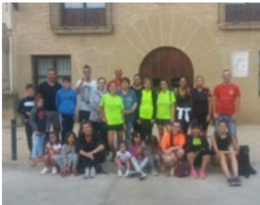
Año 2018. Foto oficial del grupo antes de salir.

Una vez lleguemos al destino, la asociación a todo aquel que se haya animado a participar en la actividad ofrecerá un bocadillo y bebida para reponer energía . Tras el descanso comenzaremos la aventura de regresar a Berbegal, ahora sí, bajo la atenta mirada de la luna.