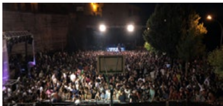
Foto de las fiestas del 2018.