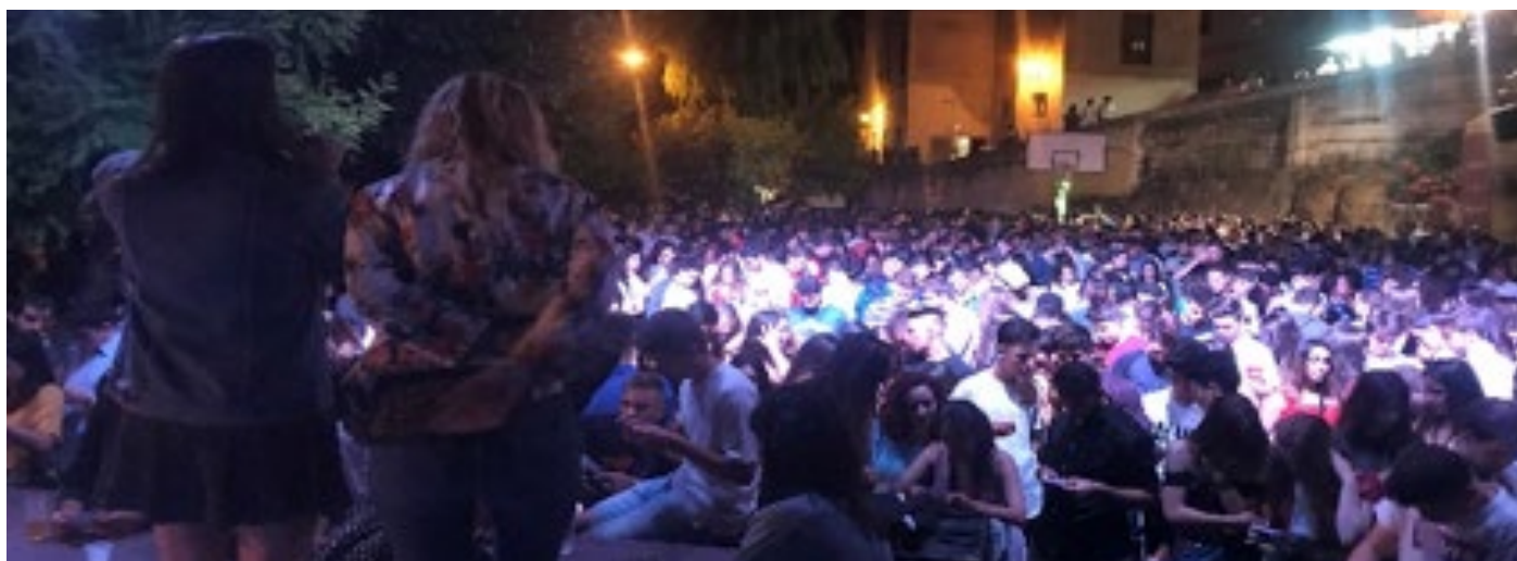
Foto del Bingo de las fiestas del 2018.

03:00. DURANTE EL DESCANSO, REALIZAREMOS EL BERBINGAZO DEL VERANO.