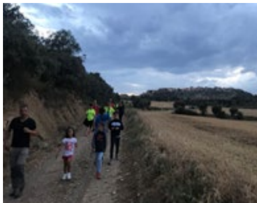
Año 2018. Berbegal comenzaba a quedar atrás.