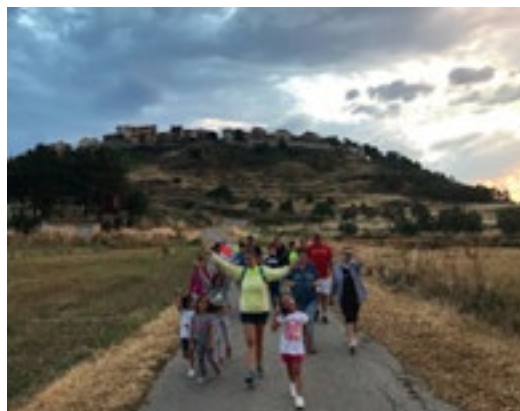
Año 2018. Bajando en el anochecer a la ermita, donde pudimos disfrutar de una noche fresquita pero perfecta para hacer ejercicio.