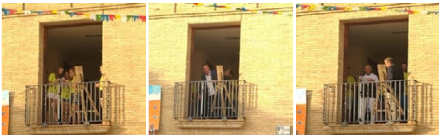
Fotos del Pregón 2018