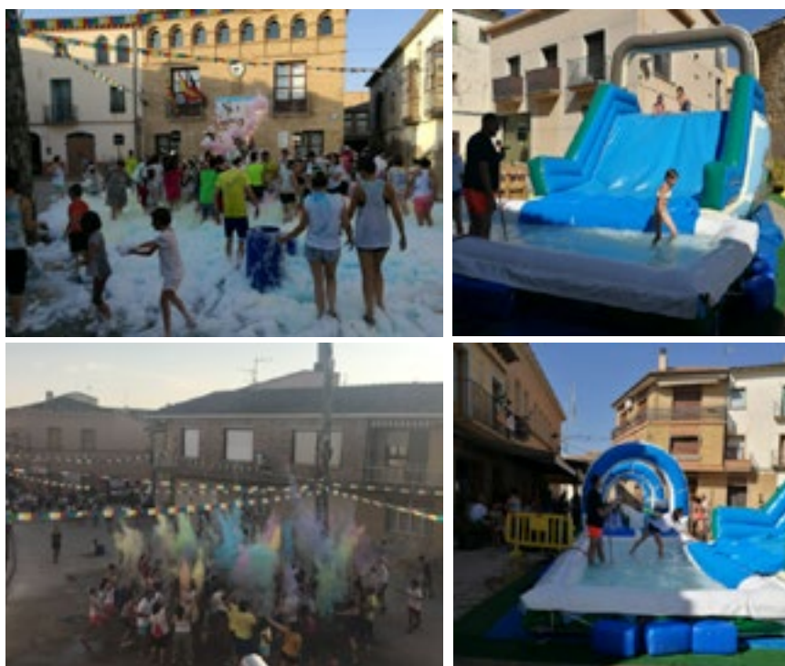
Foto de las fiestas del 2018.