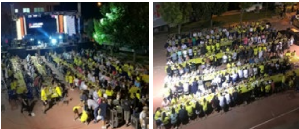
Fotos de la cena popular de las fiestas del 2018.

22:30. CENA POPULAR EN EL PARQUE MUNICIPAL OFRECIDA POR “CATERING SAN LORENZO”. Todos aquellos que deseen asistir tendrán que apuntarse en el Ayuntamiento hasta el miércoles 10 de julio. Será obligatorio llevar el ticket a la cena (menú y precio detallado en las siguientes hojas del programa). Para evitar demoras o insuficiencia de platos, a los que se apunten fuera de plazo se les aplicara un cargo extra de 5 euros por ticket.