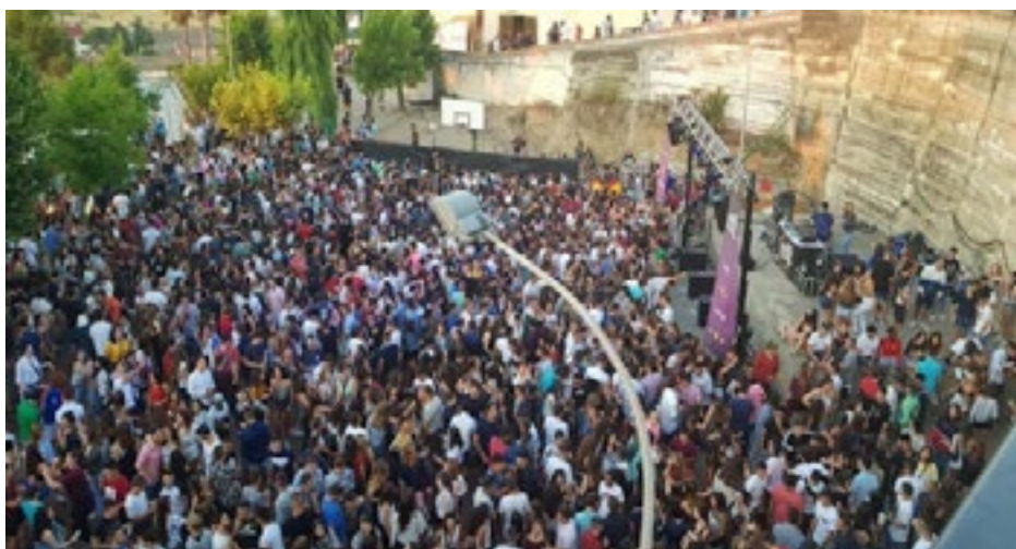
Foto del momento de la discomóvil de las fiestas 2018.