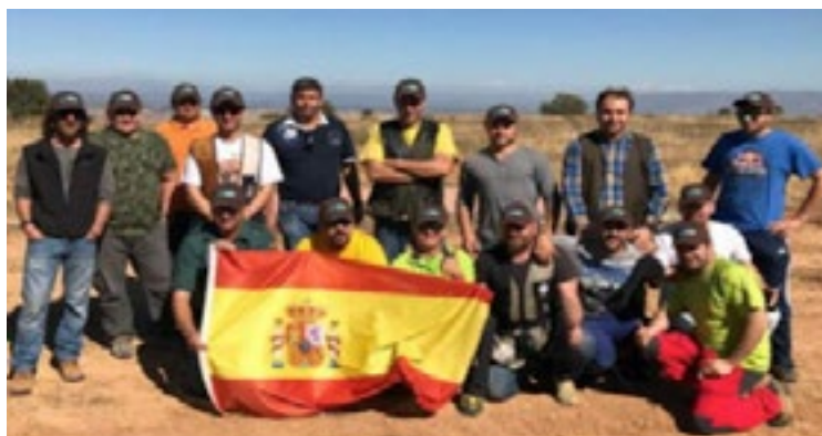
Foto de equipo de tirada al plato Fiestas de Berbegal.

Se amenizará con un almuerzo para todos los asistentes (tanto tiradores como público), a cargo del Club Tiro al Plato El Saso.