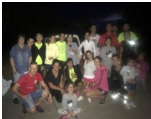
Año 2018. Foto en la Ermita, listos para la vuelta.